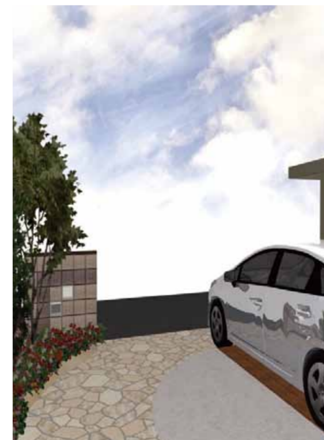
玄関側からのイメージ アプローチの入り口部を広くとること で開放的なイメージをつけました。