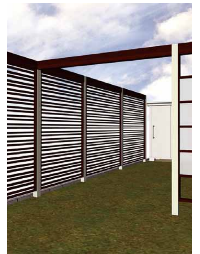
隣地境界イメージ 視線を適度にさえぎる目隠しフェンス を設置。