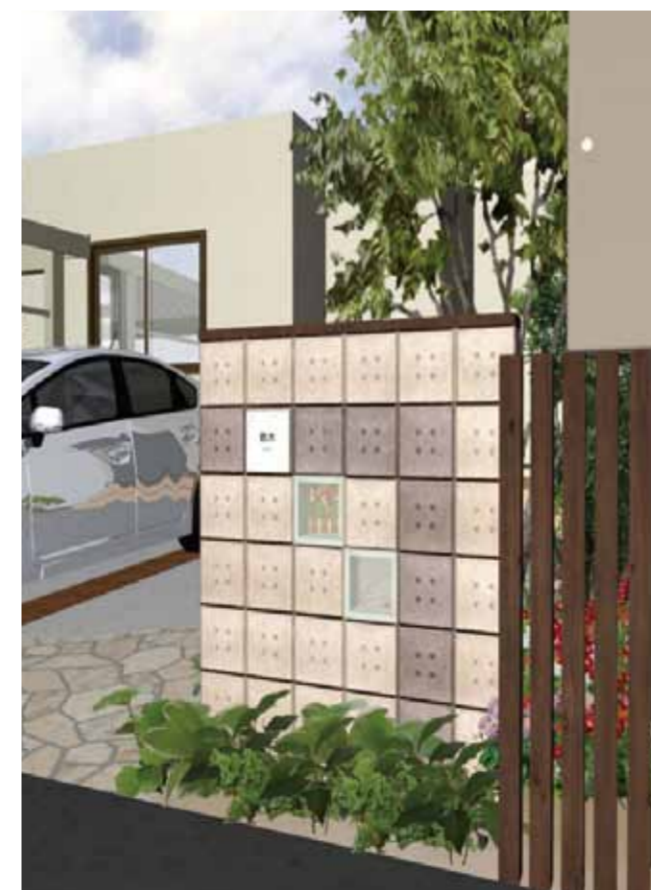
門柱拡大イメージ 意匠性のある化粧ブロックとアクセント ブロックで門柱を構成。